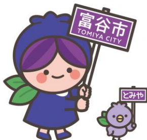
富谷市公式キャラクター 「ブルピヨ&ブルベリッ娘」

※申込方法は、みやぎ電子申請サービスを利用したインターネットによる電子申請のみとなります。