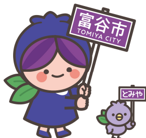
富谷市公式キャラクター 「ブルビヨ&ブルベリッ娘」