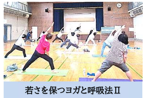
若さを保つヨガと呼吸法Ⅱ