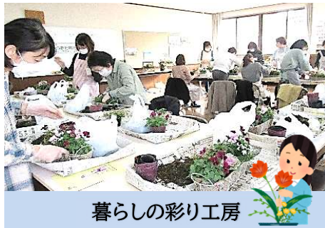
暮らしの彩り工房