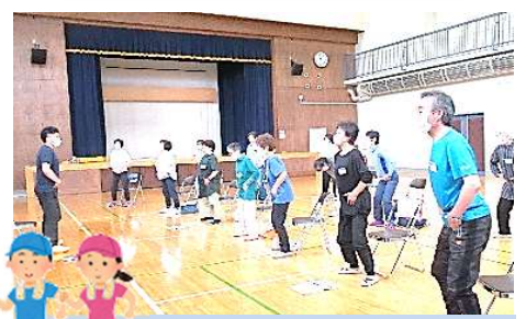
ウォーキングで健康づくり