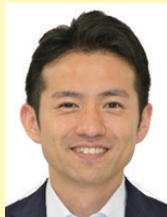
キャリアバンク株式会社 海外事業部部长

行政書士、社会保険労務士、日本語教師の有資格者で、在留資格から採用後の定着支援まで外国人材に関する幅広い知識と、介護事業所を含む様々な事業者への多数のコンサルティング経験を持ち、これまでに介護分野、農業分野など幅広い分野において100回以上のセミナー講師経験を有する。