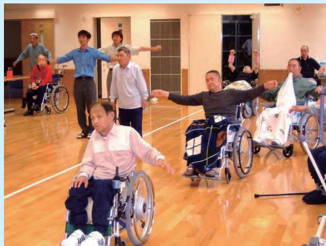
療法士の指導による体操