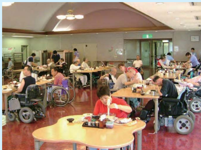
ゆったりとした食堂で食事