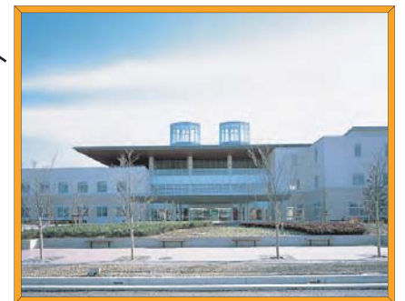
ケアフラザ新居浜