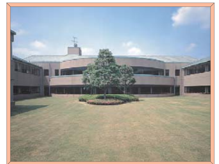
ケアフラザ四街道