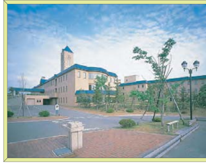
ケアフラザ岩見沢