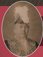
内ヶ崎 作三郎 Sakusaburo Uchigasaki

教育者・牧師・政治家、そして人生を考えぬいた 哲人・内ヶ崎作三郎氏の『人生学』とともに考える