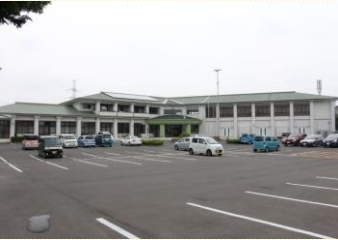
●東向陽台市民センター・出張所