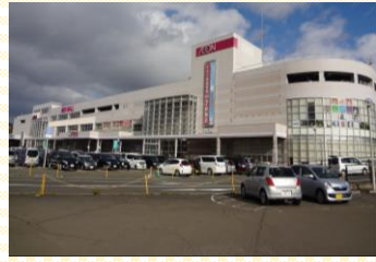
●イオンモール富谷