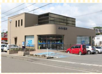
●七十七銀行富谷支店