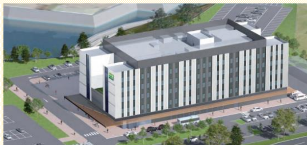
富谷メディカルセンター(仮称) イメージパース図 ※提供 学校法人東北医科薬科大学

本市では、救急・急性期を担う総合病院の誘致を推進しています。令和7年10月に病院開設等に伴う基本的事項に関する覚書を締結した学校法人東北医科薬科大学と、総合病院の立地に向けて協議を進めています。総合病院立地予定地は、明石台地区です。