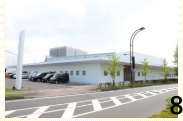
●新富谷S・Sレディースクリニック