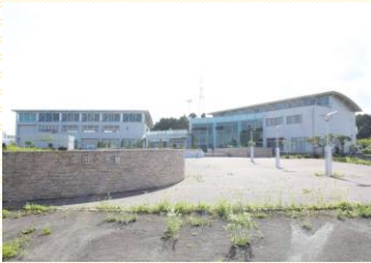
●成田市民センター・出張所