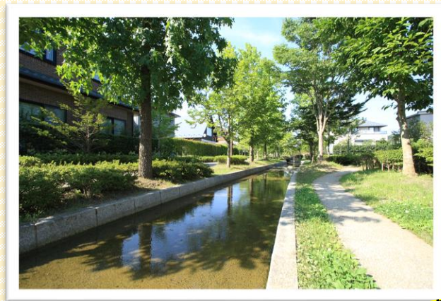
●成田せせらぎ緑道

市内には新興住宅地や大型スーパーが多く立地しているほか、各地域に保育施設・学校・商業施設・医療機関・出張所などの生活に必要な施設が立地しており、美しい街並みと生活利便性が両立しているのが富谷市の魅力です。