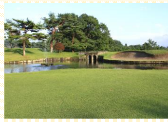
●富谷カントリークラブ