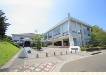
●富谷市総合運動公園