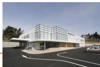
●富谷市学校給食センター