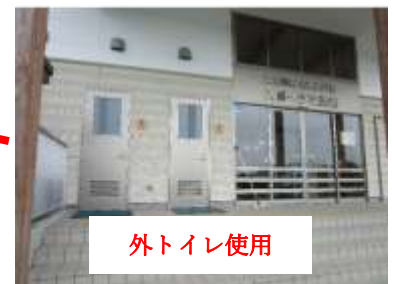
富ヶ丘市民センター敷地内（みんなの広場駐車場）（図2）