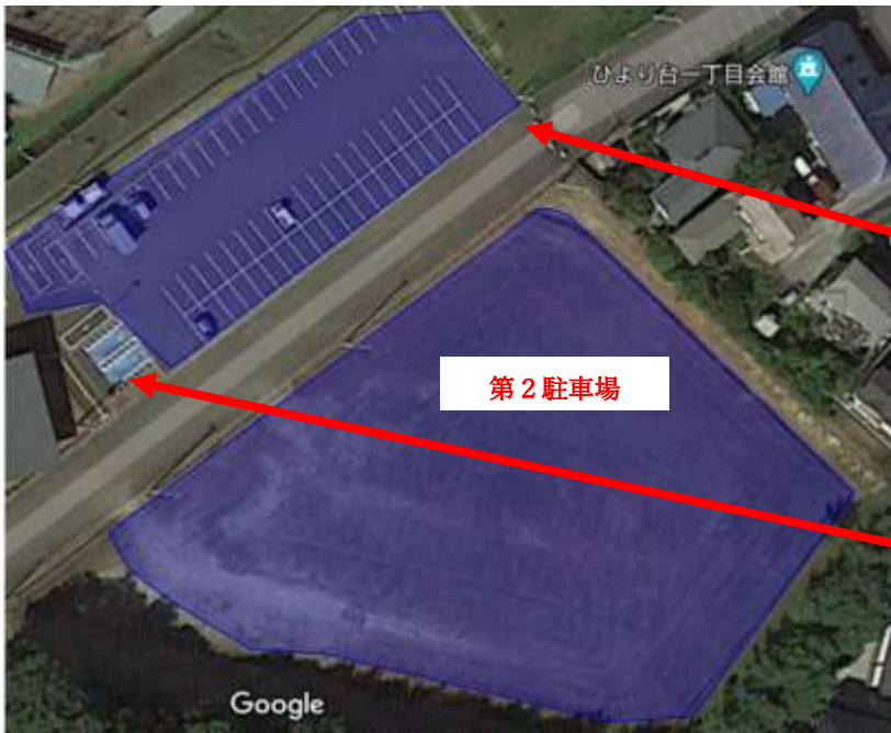
富谷スポーツセンター（スポーツ交流館駐車場）（図1）