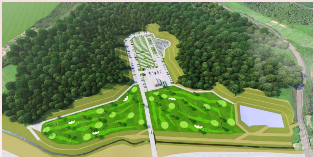
イメージ図【(仮称)やすらぎパークとみや基本設計より】

令和5年12月供用開始に向けて、現在、大亀地区に整備している墓地の見学会を以下のとおり行います。