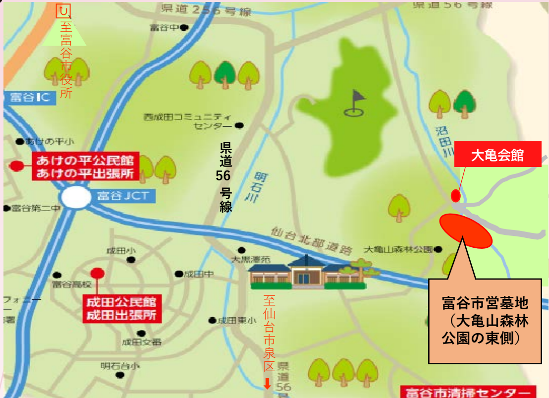
(仮称) やすらぎパークとみや周辺地図