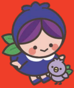
富谷市マスコットキャラクター フルベリッ娘とフルビヨ