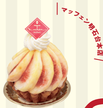
マッフェン明石本店