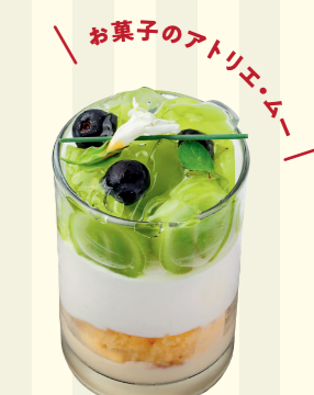
お菓子のアトリエムー