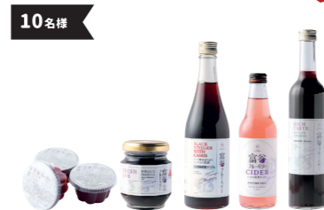
とみや詰め合わせセット3,000円相当 (ブルーベリー・バスタ・ジャム・ゼリー・サイダー等)

「フェア対象メニュースタンプ」or 「とみやスイーツ店スタンプ」2つ+ 「とみやスポットスタンプ」1つで C賞