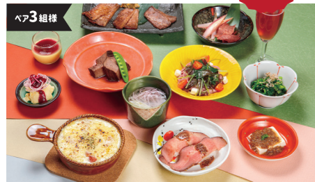
味の牛たん喜助ディナー