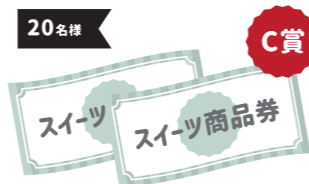
スイーツ店共通商品券 1,000円分

「フェア対象メニュースタンプ」or 「とみやスイーツ店スタンプ」2つ+ 「とみやスポットスタンプ」1つで C賞