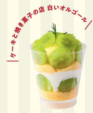
ケーキと梅も菓子の店 白いオルゴール