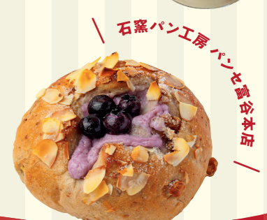
石窯パン工房 パンセ富谷本店