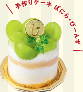
手作りケーキ ばにら・びーたぎ