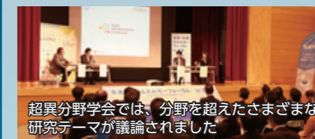
超異分野学会では、分野を超えたさまざまな研究テーマが議論されました