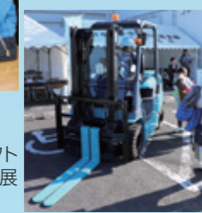
燃料電池フォークリフトや燃料電池自動車が展示されました

ハイドロカーを使った水素実験教室。富谷高校水素プロジェクトチームが協力してくれました