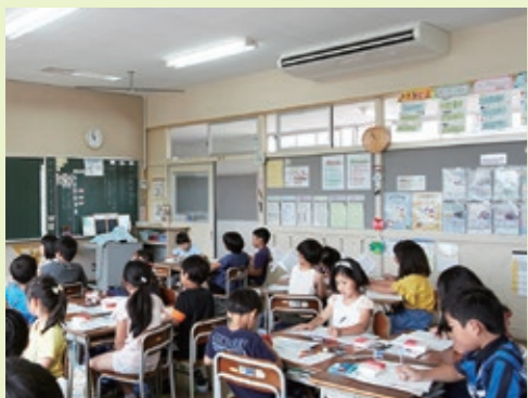
日吉台小学校の教室に設置されたエアコン

運転開始は7月1日から行います。今後はエアコンを有効に利用しながら、快適な学習環境で、子どもたちが幼稚園生活、学校生活を送れるよう運営してまいります。