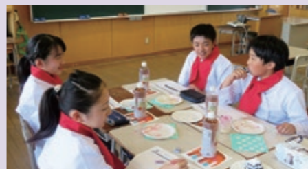
成田東小アンバサダー