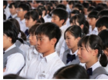
真剣に発表を聞く東向陽台中学校の生徒たち