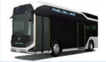
FCバス「SORA」トヨタ自動車

市では、地球環境への貢献につなぐエネルギー地産地消のまちづくりを推進するため、「富谷水素プロジェクト」の一環として、宮城県の協力のもとFC(燃料電池)バスの体験乗車会を実施します。(申し込み不要)