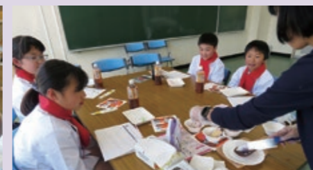
東向陽台小アンバサダー

今年も、とみやスイーツアンバサダーの子どもたちが、イベントをPRするためにチラシ・ポスターづくりに挑戦。参加店舗の限定スイーツを紹介するためのコメントを考えました