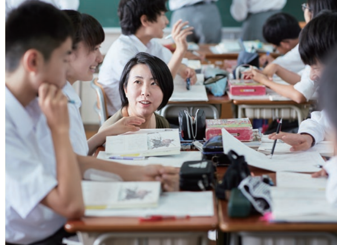
生徒の様子を観察し、分からないところを周りの生徒につなぎ、一緒に考える環境をつくるのは先生の役割

富谷市では2017年から、市内すべての小・中学校で「学びの共同体」という授業改善をスタートしています。これは授業だけでなく、学校全体を変革する挑戦でもあります。富谷の教育現場から、実際の取組を紹介します。