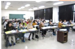
「おいしい牛乳」を試飲しました

受講生からは「手抜きのお食事を食べることが多くなってきたので、今回の話を聞いてまず食事をバランスよく美味しく食べようと思いました」「頭で理解できていても意識して行動することの難しさを痛感しています」等の感想が寄せられました。