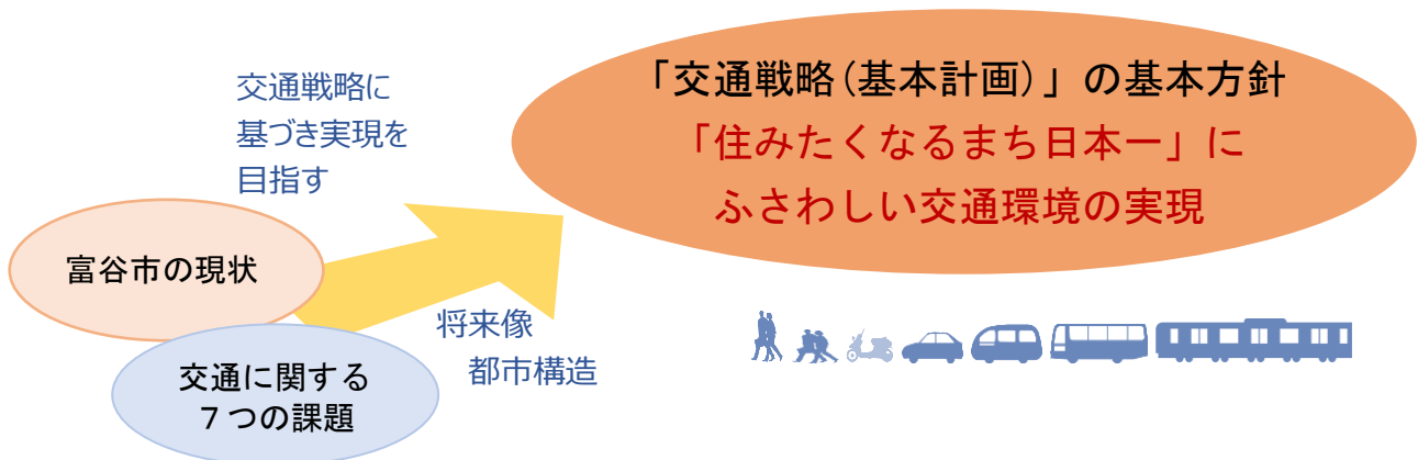
■図 基本方針の設定