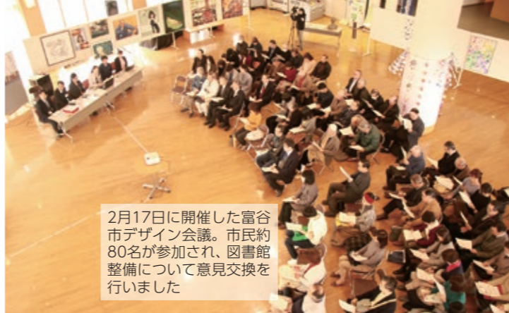
2月17日に開催した富谷市デザイン会議。市民約80名が参加され、図書館整備について意見交換を行いました

当社は、昭和12年に八十島製作所として大阪で創業し、創業50周年を機に八十島プロシード株式会社へと改称しました。主に、工業用プラスチック切削加工品の製造・販売および3Dテクノロジーサービスを行っております。 日常の中で、目にすることはありませんが、生活する上で、なくてはならない半導体や精密機器・食品製造機械の一部などの幅広い分野で使用されています。 隣接する仙台工場では、主に医療機器を中心とした製品を取り扱っており、振動制御構造や温湿度管理、集中管理システムを導入し、高い品質管理と高精度加工ができるつくりとなつています。製品を大量生産するのではなく、全国からのご注文を受けて、お客様が必要とする製品を高精度の切削加工技術を駆使して、一つ一つ丁寧に生産しています。 平成18年12月に支店と工場を富谷へ開設した当初は、切削加工を行う機械や従業員も少なく、皆手探りで業務を行ってまいりました。それから10年が経ち、おかげさまで受注が増えてきましたので、一昨年に業務の拡大と生産力の向上を目指して、仙台工場のⅡ号棟を増築しました。 良い仕事をするためには、円滑な職場環境や生活基盤となるまちに活気があることが大切だと思います。 町から市になり、ますます盛り上がりを見せる富谷市とともに、これからも「未来を削り出す」をスローガンに、私たちにしか実現できない高い技術力と品質管理にこだわりながら、お客様の要望にお応えしていきたいと考えています。