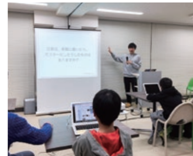
2月に市民を対象に開催したプログラミング教室。参加者から大きな反響を得ました

将来的には、富谷でプログラミングを学んだ子どもが世界中で活躍し、その後富谷へ戻って起業するといったサイクルが理想的だといいます。 「海外では現にそうしたことからIT産業が活性化している地域もありますし、市内で優秀なIT人材を生み出す土壌をつくることは、大きな意義があると思います」と続けました。 4月以降はIT教育者養成プログラムも開講予定ですので、ぜひご参加ください。