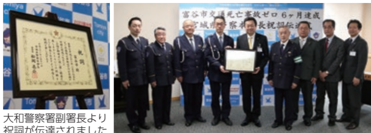
大和警察署副署長より 祝詞が伝達されました

今後も交通死亡事故ゼロを継続し、安心安全なまちづくりを推進してまいります。(2月19日(火)に祝詞伝達式が行われました。)