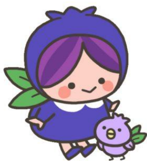
富谷市公式キャラクター 「ブルビヨ&ブルベリッ娘」