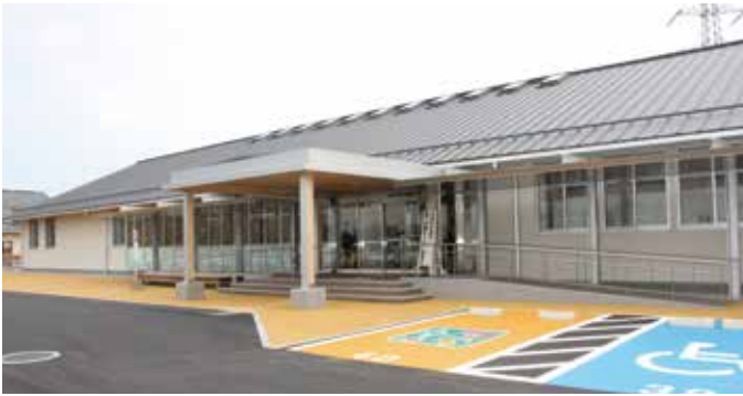
とみや子育て支援センター“とみここ”