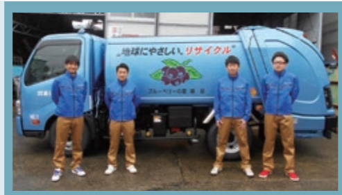
ごみ収集を委託する富谷環境の作業着が変わりました。

☎生活環境課 廃棄物担当 ☎358-0515 【ルールが守られていない例】 ・缶の中に異物(ビニール袋など)が混入している。 ・割れ物として、破碎した状態のテレビブラウン管が収集カゴに入れられている。