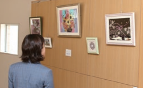
バラやアジサイなどの押し花でつくられたアートな作品 が展示されました