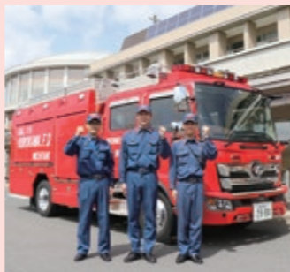
1.5トン水槽付きの消防ポンプ車が、新たに富谷消防署へ配備されました。