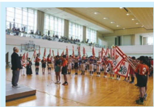
5月12日(土)に富谷スポーツセンターで、富谷市スポーツ少年団結団式を開催。24団、363名が参加し、団員の健康づくりと互いの交流・親睦を深めました。

「家族・お友達と、ぜひご参加ください。」 【日時】7月8日(日) 【会場】富谷スポーツセンター 【対象】市民の方 【申込】6月22日(金)まで、各地区スポーツ普及員を通して申し込みください。