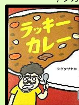
ラッキーカレー/シゲタヤユカ