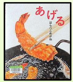
あげる/はらぺこめかね