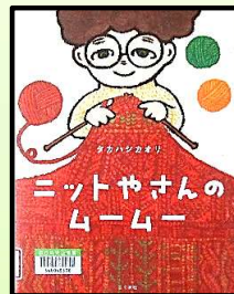
ニットやさんのムーム / タカハシカオリ