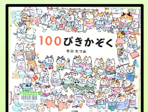
100ぴきかぞく/古沢たつお