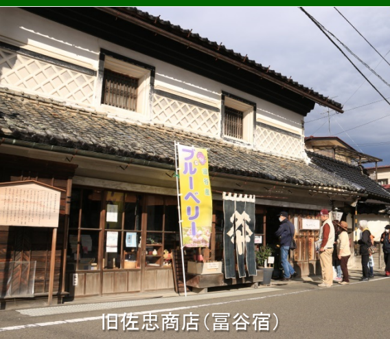
旧佐忠商店(富谷宿)