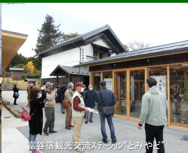
富谷宿観光交流ステーション“とみやど”