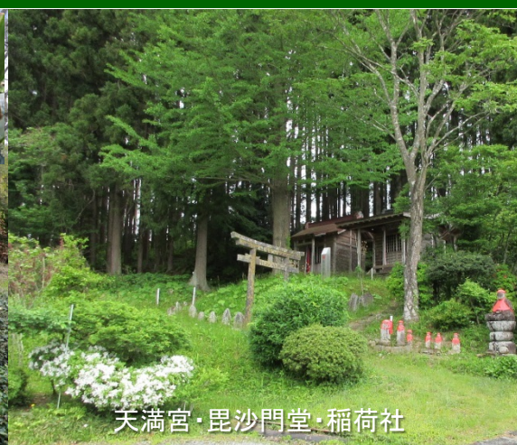
天満宮・毘沙門堂・稲荷社