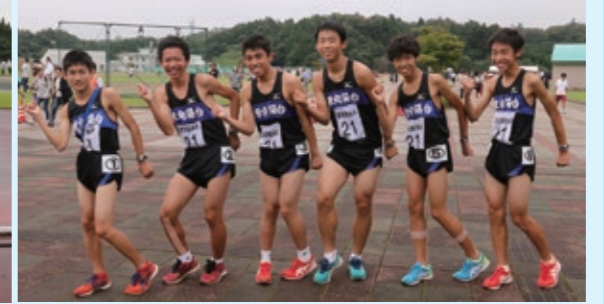
男子：東向陽台中Aチーム