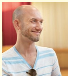
作者:メイナード プラントさん (MONKEY MAJIK/ヴォーカル・ギター)

市制施行1周年を迎えるにあたり、市民歌の制作に込めた思いをあらためてお聞かせください。