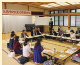
第3回わくわく市民会議 (8/28)