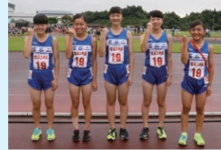
女子：富谷第二中Aチーム