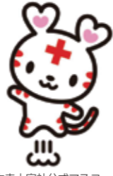
日本赤十字社公式マスコットキャラクター「ハートラちゃん」

5月1日から6月30日までに行われた赤十字会員募集運動について、市民の皆さんや法人団体の皆さんから多くの会費のご協力をいただきました。