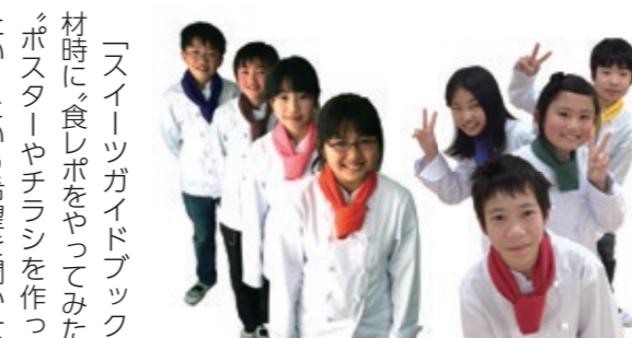
富谷小学校・明石台小学校の「とみやスイーツアンバサダー」の皆さん

「スイーツガイドブックの取材時に、食レポをやってみたくて、ポスターやチラシを作ってみたくて」という希望を聞かせてくれたこともあって、今回のチラシ制作に参加してもらったことに