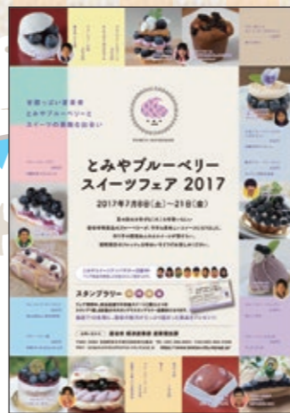
ブルーベリースイーツフェアのチラシ