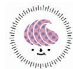
人々が甘いものに出会ったときの笑顔を表現した「とみやスイーツ」のロゴマーク。(こちらはブルーベリースイーツバージョン)