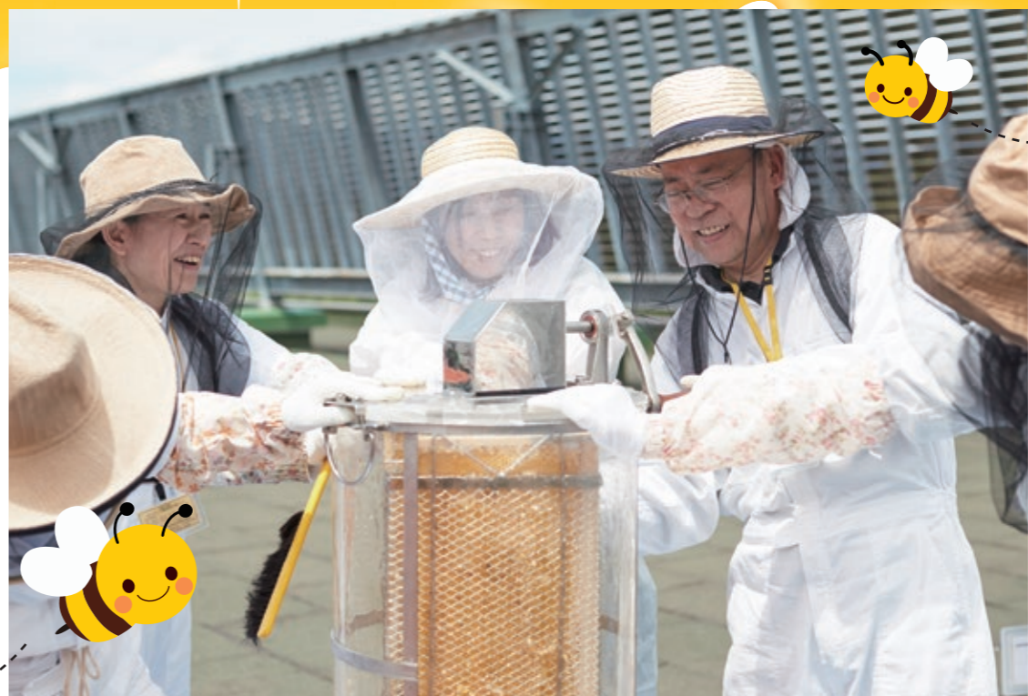
チームワークの良いプロジェクトメンバーの皆さん、現場は笑顔が絶えません