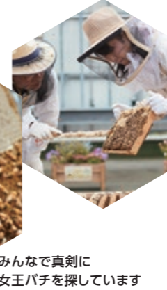
みんなで真剣に女王バチを探しています