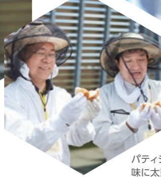
味見してこぼれる笑顔。生産に関わったからこそおいしさは格別です