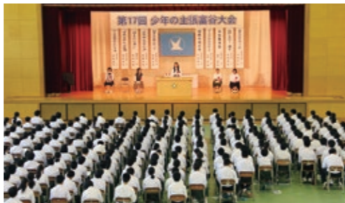
中学校を会場に初の開催。富谷中の生徒が同世代の主張に耳を傾けました。