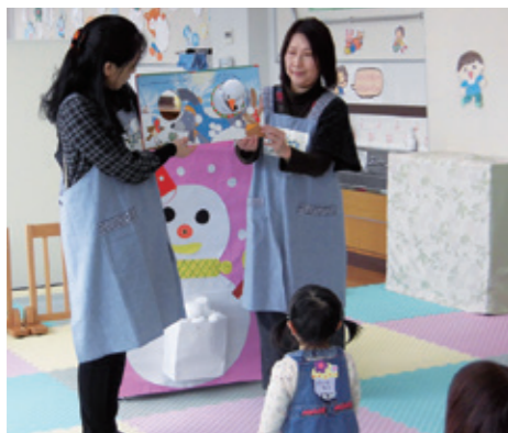
「お話し会」東向陽台公民館プレイルーム