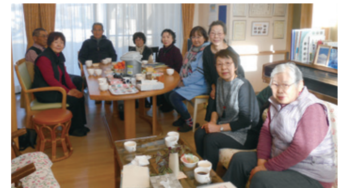
暖々の会(認知症を考えるカフェ)