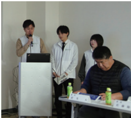
上：しんまち活性化協議会で発表する学生たち。その発表内容は委員から好評でした 右：アンケート会場で寄せられた皆さんのアイデア

また開拓400年に向け、しんまち活性化協議会にも参画。地域住民によるまちづくりの現場で、住民の意見に耳を傾け、古民家の再生と一緒に汗をかく体験もしました。この活動から、学生は自発的にしんまちの在り方を問う100人アンケート調査を実施。結果を協議会で発表したところ、委員からは「自分たちの考えが可視化できた」と好評を得るなど、学生の調査は、住民の合意形成に好影響をも