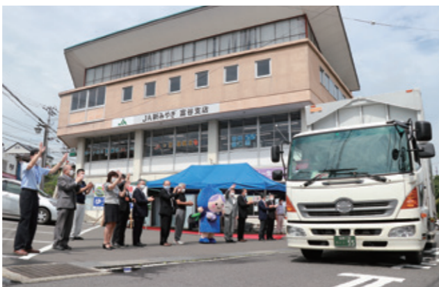
7月に開催された富谷産ブルーベリーゆうパック出発式。 関係者がそろって初出荷のトラックを送り出しました

包括協定に基づく新事業として、市内の郵便局に市広報の無料掲示コーナーを新設したり、市内5局の全社員に認知症サポーター研修を受講させる計画が組まれたり、次々に動き出しています。