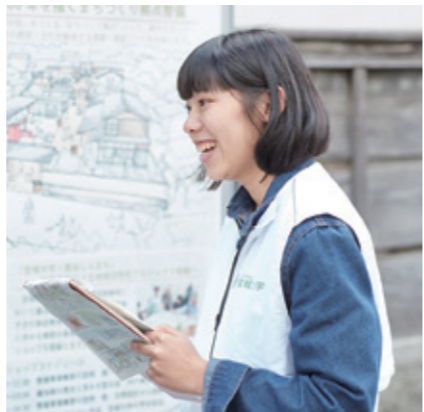
しんまちの100人アンケートでは、住民の声を拾い、一人一人の意見を受け止めて分析する調査研究を実施

民の理解があつたこと」と話します。きっかけは、4年前に基礎ゼミの試みを市が受け入れてくれたこと。200人の学生に富谷を自由研究させ、課題解決のアイデアを競わせました。このときの手応えから、長期的な視野で地域人材を育てる重要性に気付き、市と連携して取組を深化させてきました。