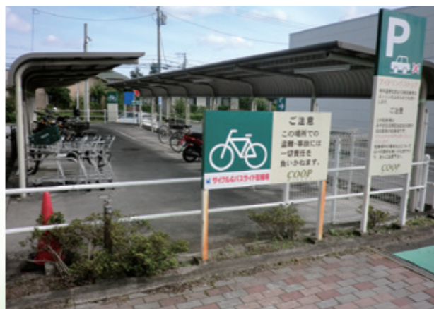
明石台店の駐輪場に市章と事業名のステッカーが貼られています

実施中の連携事業としては、「明石台サイクル&バスライド」があります。これは泉中央までの交通渋滞緩和策として試行している社会実験です。自宅から明石台店の駐輪場まで自転車で行き、そこからバスに乗り換え泉中央駅へ向かってもらうものです。連携で培った良好な協力体制のおかげで、この事業もスムーズに実現できました。