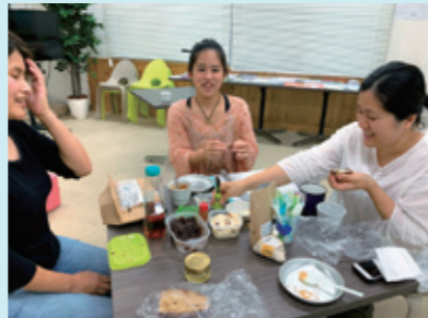
きな粉のおいしい食べ方を研究する「きな粉研究会」。自分に合った部活を探してみてください

現在、それぞれの想いを実現するための第一歩として、30以上のさまざまな部活動が立ち上がり、多くの塾生が楽しみながら活動を続けています。新たな部活動を立ち上げることのみならず、今ある部活に入っていただくことも可能です。いつでも誰でも入塾できますので、まずは、どんな部活動があるのかも含めて気軽にご相談ください。