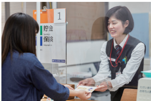
「とみや応援3割増商品券」の販売窓口が郵便局になって便利と好評