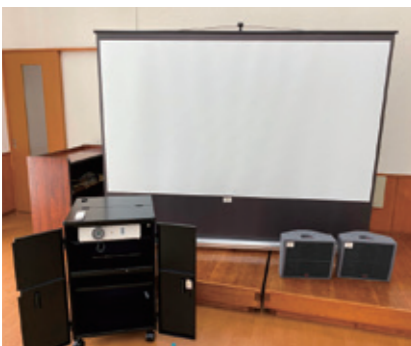
あけの平二丁目町内会に設置された音響・映像機器

一般財団法人自治総合センターが宝くじ社会貢献広報事業として実施している一般コミュニケーション助成事業を活用し、あけの平二丁目町内会で音響・映像機器を整備しました。この事業は、地域社会の健全な発展と住民福祉の向上に寄与するために行われているものです。