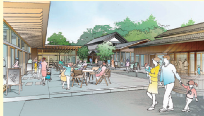
「とみやど」はしんまち通りに面し、内ヶ崎酒造店の向かいです

4月17日(土) 午前10時グランドオープン 3月28日(日) 午前10時プレオープン