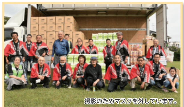
撮影のためマスクを外しています。

9月20日(日)に、鷹乃杜応援祭を開催しました。コロナ禍で夏祭りを開催できなかったのが、町内会の皆さんがより楽しく、元気に過ごせるように抽選会を企画しました。