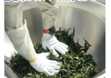
栽培している3年目の茶木の柔らかい葉を釜で炒り、製茶しました(10/13)