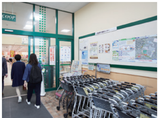
明石台店入り口に設置された富谷市情報コーナー。明石台サイクル&バスライドのポスターが貼られていました

みやぎ生協は、力を注ぐ社会貢献活動で、豊富な実績とノウハウを持つ組織です。福祉や子育て、環境などに関する取