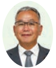
村上 治 議員