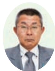
金子 透 議員

もない時期の産婦に対 する健康診査費用の助 成を開始し、妊娠から 子育てにわたる切れ目 のない支援の充実に つとめます。