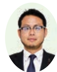
藤原 峻 議員

診できる医療機関などの情報を掲載し、内容の充実を図り、必要な情報を容易に検索できるように改善を図ります。