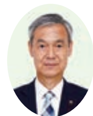
安住 稔幸 議員