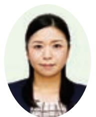
菊池 美穂 議員