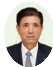
浅野 武志 議員