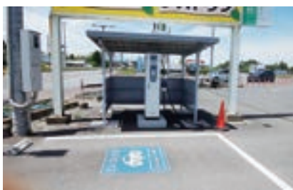
▲ 充電ステーション