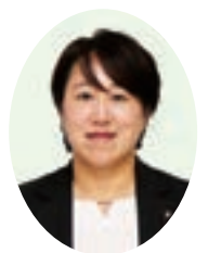
渡邊 清美 議員