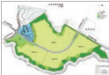
▲高屋敷西地区 土地利用計画図