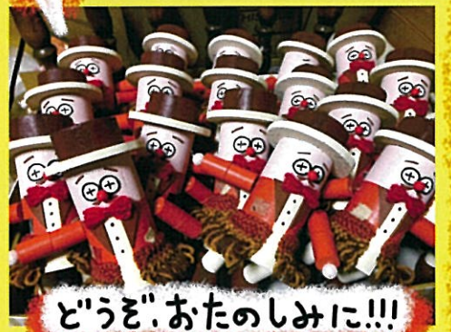
どうぞ、おたのしみに!!!