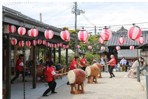
とみやど2周年記念祭