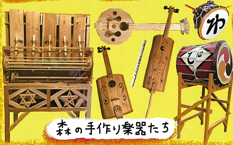
木の手作り楽器たち