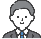
キャリア コンサルタント