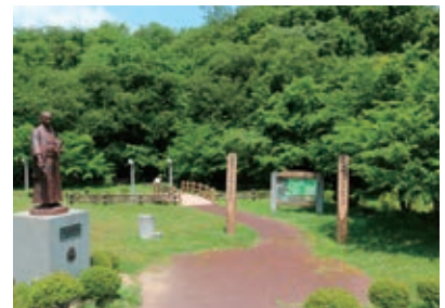
支倉常長メモリアルパーク（大郷町）