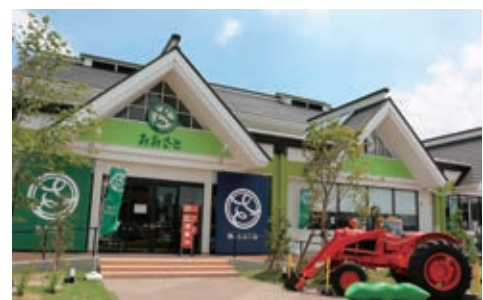
道の駅おおさと（大郷町）