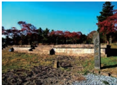
特別史跡多賀城跡附寺跡（多賀城市）