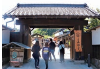
富谷観光交流ステーション「とみやど」（富谷市）