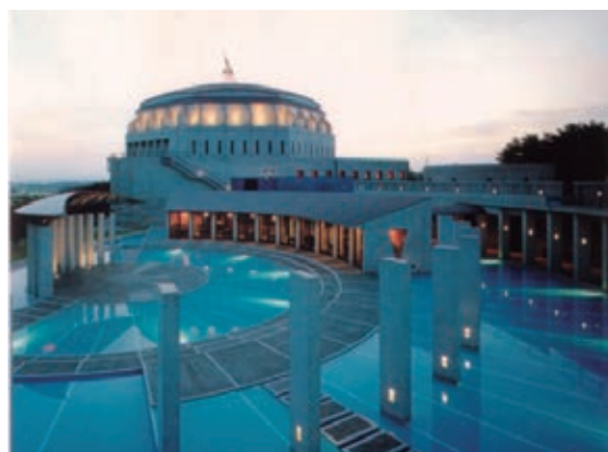
七ヶ浜国際村（七ヶ浜町）