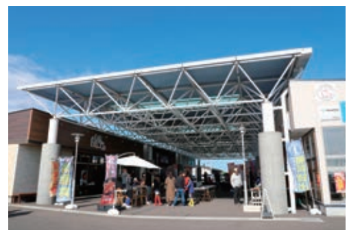
荒浜にぎわい回廊商店街（巨理町）