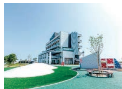
名取市サイクルスポーツセンター（名取市）