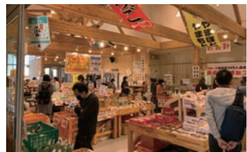
山元町農水産物直売所「やまもと夢いちごの郷」(山元町)