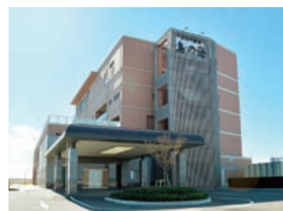
わたり温泉鳥の海（巨理町）