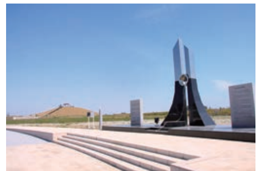
千年希望の丘（岩沼市）