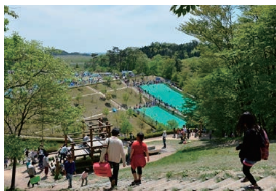
万葉クリエートパーク（大衡村）