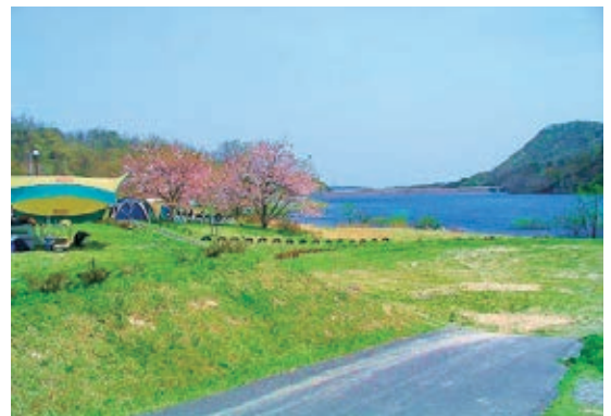
牛野ダムキャンプ場（大衡村）