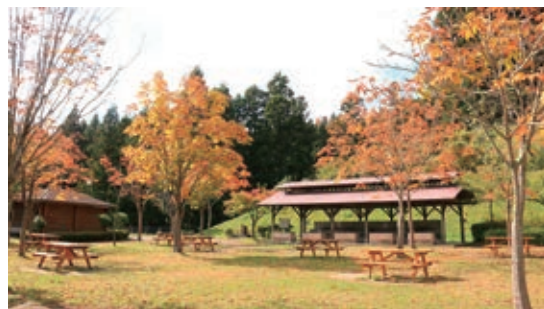
大亀山森林公園（富谷市）