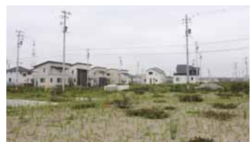
第Ⅲエリア (6月16日撮影)