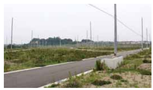
第Ⅱエリア (6月16日撮影)

現在、開発が進められている明石台地区です。電柱が立てられ道路が引かれ、これから本格的に住宅が建てられます。第Ⅲエリアの一部ではすでに住宅が建てられています。