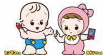
※国勢調査マスコットキャラクター「センサスくん」(左)と「みらいちゃん」(右)

前回の調査は、すべての調査票が封入で提出されましたが、今回の調査では、高齢者世帯など調査票の記入に不安のある方に調査員が記入のサポートを行い、円滑な調査を実施するため、封入は調査対象世帯の任意で行います。