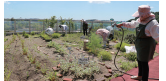
成田公民館の屋上にあるハーブガーデン。このハーブガーデンは、ボランティアサークル「ろーずまりー」の皆さんがお世話しています。この日は、水やりや草取りを行いました(撮影日:6/8)