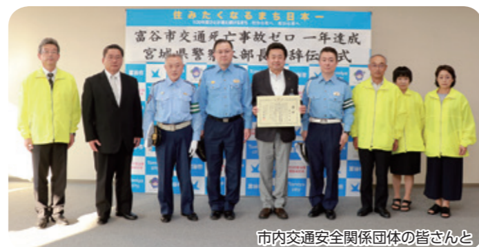
市内交通安全関係団体の皆さんと

6月10日(水)、市内での交通死亡事故ゼロ1年を同月9日(火)に達成したことを受けて、宮城県警察本部長名の讃辞が贈られました。市内では、昨年大清水地内の国道4号で起こった普通乗用車の衝突事故から1年間、死亡事故が発生していません。