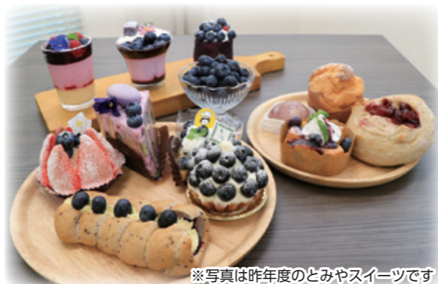
※写真は昨年度のとみやスイーツです

菓子処いさわ屋/白いオルゴール/ぱいら・びーんず/ お菓子のアトリエ・ムー/マツフェン明石台本店/餅よし/ 石窯パン工房パンセ富谷本店/MonaMona富谷成田店/ ノワイエ/パン・デ・パルコ (順不同)