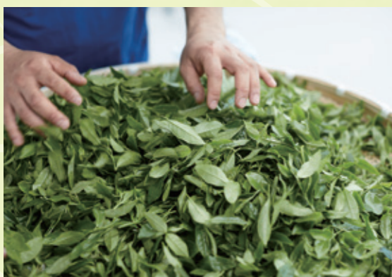
摘み取られたみずみずしい一番茶。施肥などの手入れをされた茶木に、活力が戻っているのがわかります