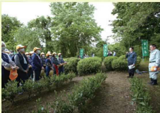
現在の氣仙屋茶畑で行われた今年の新茶の摘み取り。手前が一昨年植えた苗、奥が守られてきた在来種

飲料水やスイーツの原料として富谷茶を利用できるよう、本市の新たな6次産業化を目指して、今後も取り組んでいきます。