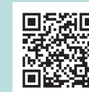
市公式 ホームページ

今回、独自経済対策第3弾として、子育て世代や高齢者世代まで、あらゆる世代を対象に支援を実施することとし、令和2年第2回富谷市議会定例会(6月9日開会)へ関連経費を補正予算として上程し、可決され成立しましたので、概要をお知らせします。今後も、国・県等と連携を図りながら、新型コロナウイルス感染症の経済対策を迅速に進めてまいります。(6月18日現在) ※最新情報は、市公式ホームページ専用サイトをご覧ください。