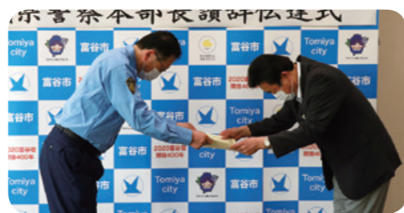
交通死亡事故ゼロ1年の達成は、平成29年9月26日以来

市では、今後も市民の皆さんや関係団体と連携し、オール富谷で交通事故のない富谷市を目指してまいります。