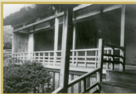
左：明治天皇が休息された奥座敷。一部が今も残されています