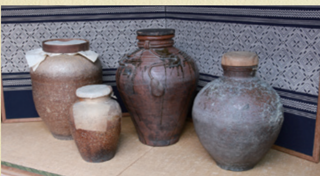
左端の茶つぼが製茶作業写真の茶つぼと同じものです