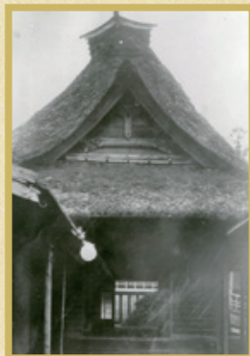
脇本陣の格式を備えたかやぶきの建物だった