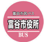
※バス停留所イメージ

※バス停留所およびその周辺で、ゴミのポイ捨てや喫煙、私有地への無断立ち入り等は地域住民の方々への迷惑になりますのでお止めください。