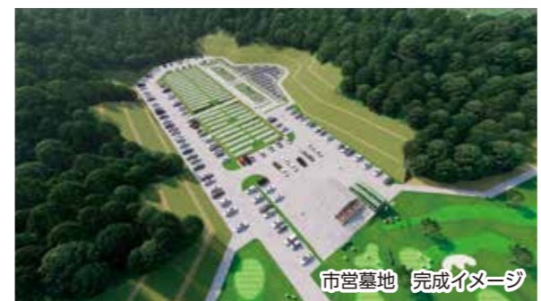
市営墓地 完成イメージ

今後は、この基本設計をもとに、実施設計や造成工事などを開始します。市営墓地は令和5年度中、パークゴルフ場は令和6年度に利用開始の予定で計画を進めています。