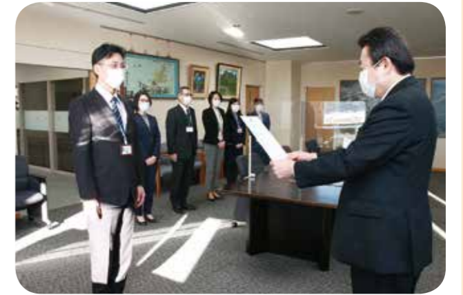
対策チームは1月6日に発足。市職員6人で構成しています