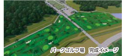
パークゴルフ場 完成イメージ

大亀山森林公園の東側に整備する、市営墓地とパークゴルフ場が一体となった施設「(仮称)やすらぎパークとみや」の基本設計が、昨年11月に完了しました。