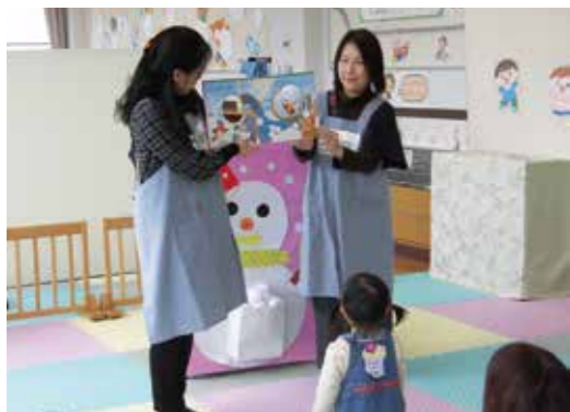
「おはなしやま」東向陽台公民館