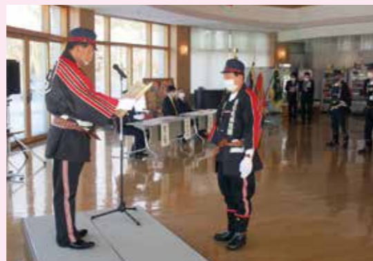
長年、消防活動に尽力された団員へ、団長から表彰状が伝達されました

今年は、明石班へ小型動力消防ポンプ軽積載車の配備を予定しており、16班全班への車両配備が完了します。