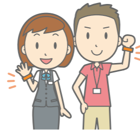
オレンジリングは「認知症の人を応援します」という意思を示す「目印」