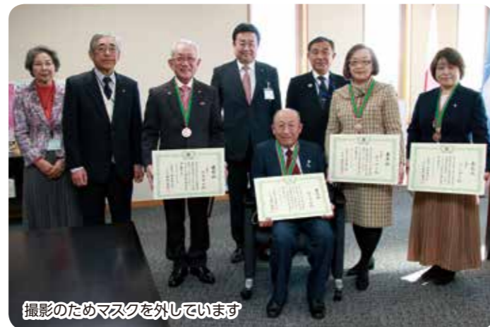
撮影のためマスクを外しています