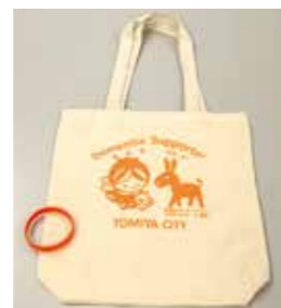
エコバックは富谷市全体で認知症を支える「連帯の証」

市が実施している「認知症学びの講座」を受講した人の名称です。認知症サポーターは、認知症の方に対して、できる範囲で手助けする応援者です。市内の認知症サポーターはまだ多くありません。認知症は誰でもなり得る病気です。他人ごとではなく自分たちの問題として捉え、何ができるかを一緒に考えていきましょう。