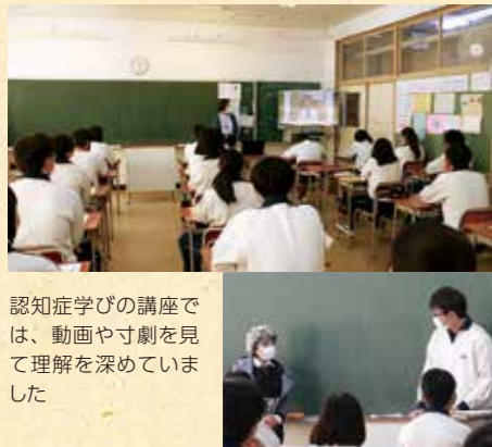
認知症学びの講座では、動画や寸劇を見て理解を深めています

側が楽になる」「みんなが知っていれば、相談しやすくなる」と二人は言います。さらに「一番つらいのは本人なので、そのつらさを理解して接することができれば」と言葉を重ねます。 富谷がどんなまちになってほしいかと聞くと、「認知症を否定的に捉えず、もっとやさしくポジティブに接していける人が増えてほしい」と答えてくれました。そして今後は「自分の祖父母はもちろん近所のお年寄りも、気になる行動を見かけたら、しっかりと勇気を持って話しかけるようにしたい」と心掛を力強く話してくれました。