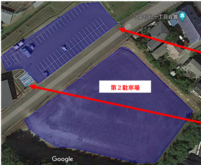
富谷スポーツセンター（スポーツ交流館駐車場）（図1）