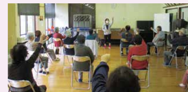
介護予防教室「認知症・あたまの体操」