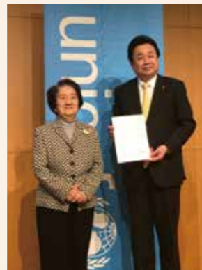
ユニセフ協会から子どもにやさしいまちづくり検証作業自治体の委嘱を受けました

市長 ありがとうございます。委嘱の翌月に「富谷市子どもにやさしいまちづくり宣言」を行いました。また、推進庁内連携会議を開催しながら、検証作業を進めているところです。