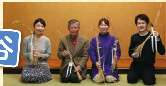
※撮影のため、マスクを外しています。