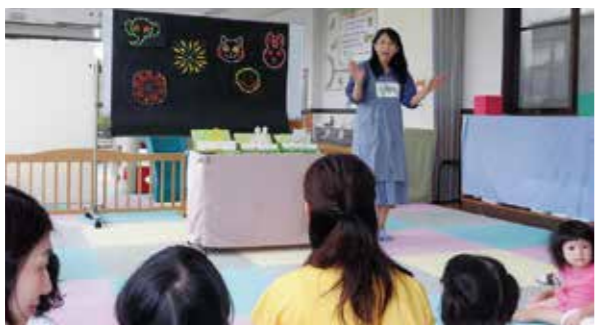
「おはなしやま」東向陽台公民館