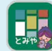
地図アプリためまっぷ

市では、まちの情報を集約して皆さんにお届けする地図アプリ「ためまっぷ」を活用し、とみやスイーツの情報をまとめた「とみやスイーツマップ」を作成中です。これは、TOMI+の実証事業「おためしイノベーション富谷」の一環として行っています。マップ上には、店舗情報のほか、多くの方のスイーツにまつわる思い出エピソードを掲載し、「スイーツのまち=とみや」の楽しい情報をお届けする予定です。