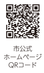
市公式ホームページ QRコード