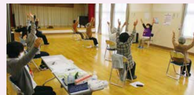
介護予防教室「コロナに負けない体づくり」