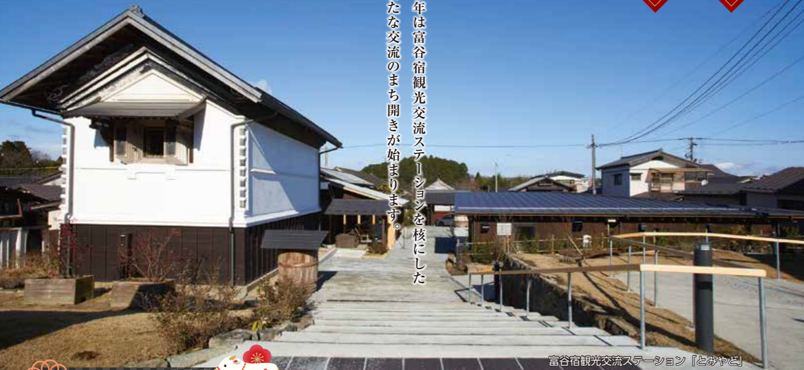
富谷宿観光交流ステーション「とみやど」