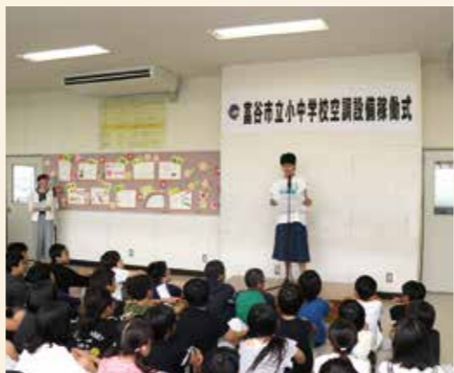
児童や保護者からの要望を受け、小・中学校へのエアコン設置も県内で最初に実現しました