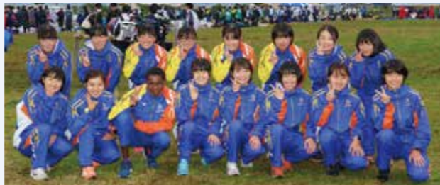
門脇さん(前列左から4番目)とチームメート