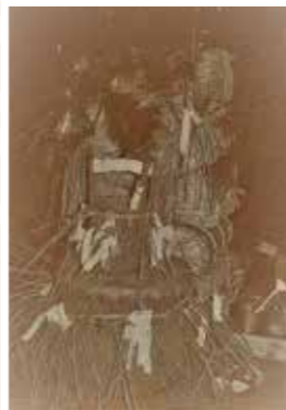
西成田地区の松飾り

このように富谷では、正月に関する文化や風習が数多くありました。姿を消してしまったものが多いですが、民俗ギャラーでその一端を見ることが出来ますので、ぜひお越しください。(執筆・富谷市民俗ギャラー学芸員 清水勇希)