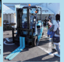
燃料電池フォークリフトや燃料電池自動車が展示されました

ハイドロカーを使った水素実験教室。富谷高校水素プロジェクトチームが協力してくれました