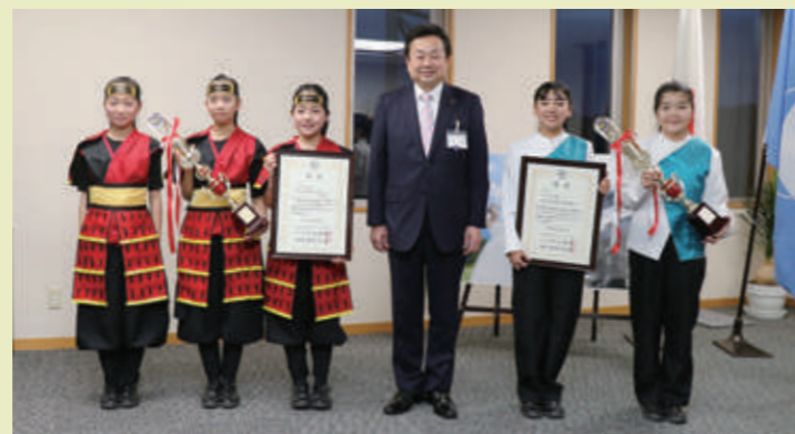
市長を訪問した富ヶ丘小金管バンドと成田東小金管バンド

3年連続3回目の出場だった富ヶ丘小金管バンドは小学生の部小編成で金賞、4年ぶり7回目の出場を果たした成田東小金管バンドは、小学生の部大編成で銀賞を受賞しました。22年連続23回目出場のとみやマーチングエコーズは、一般の部大編成で銀賞を受賞しています。皆さん、おめでとうございます。