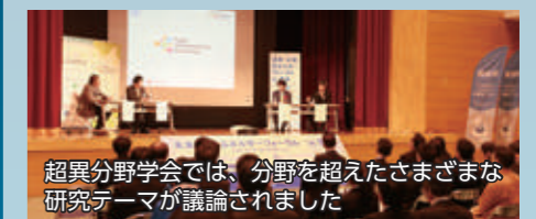
超異分野学会では、分野を超えたさまざまな研究テーマが議論されました