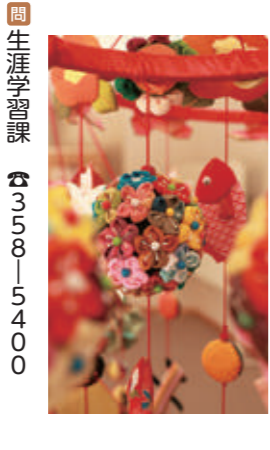
問 生涯学習課 ☎358-5400