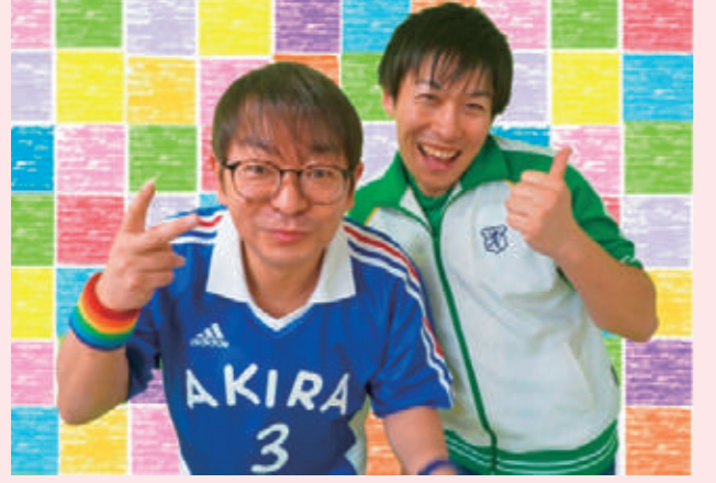
問・甲 子育て支援センター ☎343-5528

『秘伝! ラーメン体操』でおなじみのあきらちゃんとジャンプくんがとみこにやってきます。全国各地で大活躍の二人と一緒に、歌って踊ってあそびましょう。 【日時】2月12日(水) 10:00〜11:30 【対象】0歳児〜未就園児と保護者 ※動きやすい服装と水分補給できるものをお持ちください。