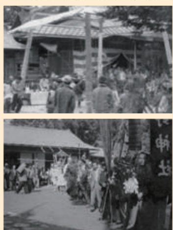
(左上) 4本柱が許されていた格式高い熊野神社の土俵で行われた奉納相撲。まわしを締めた力士の姿もみえます