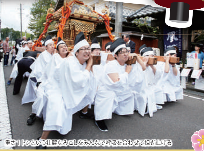
重さ1トンという壮麗なみこしをみんなで呼吸を合わせて担ぎ上げる