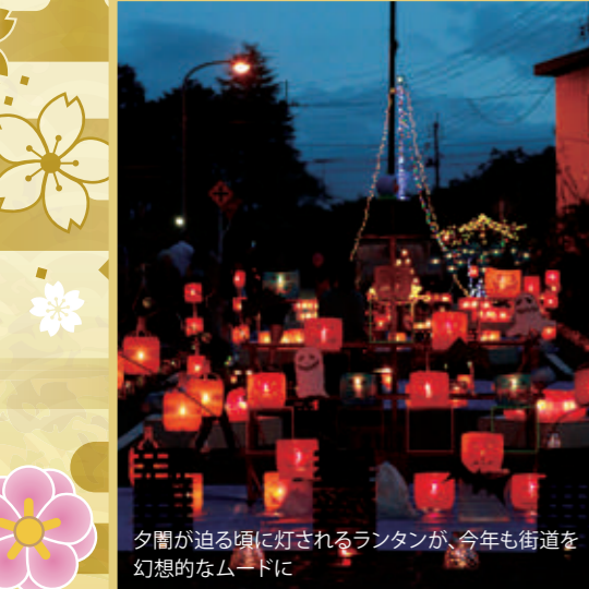
夕闇が迫る頃に灯されるランタンが、今年も街道を幻想的なムードに