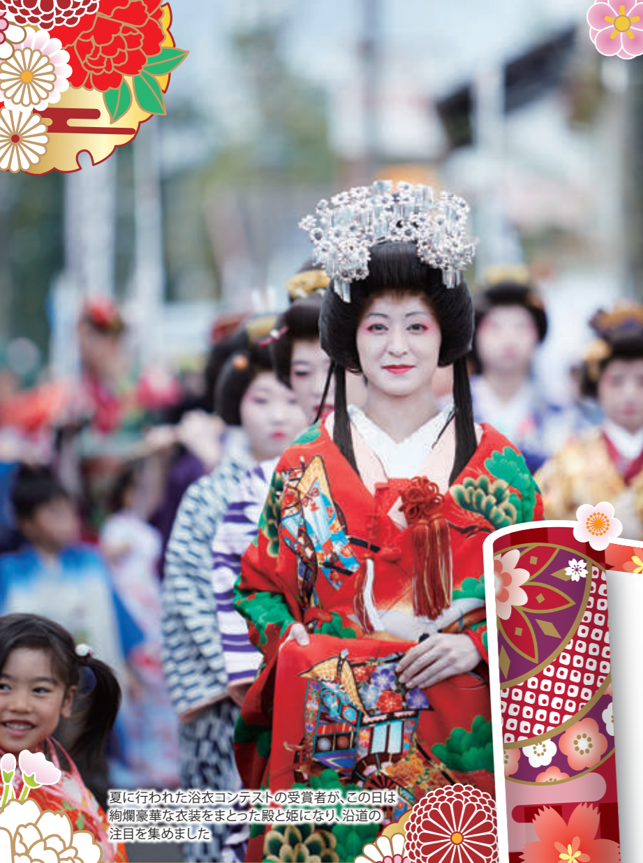
夏に行われた浴衣コンテストの受賞者が、この日は絢爛豪華な衣装をまとった殿と姫になり、沿道の注目を集めました