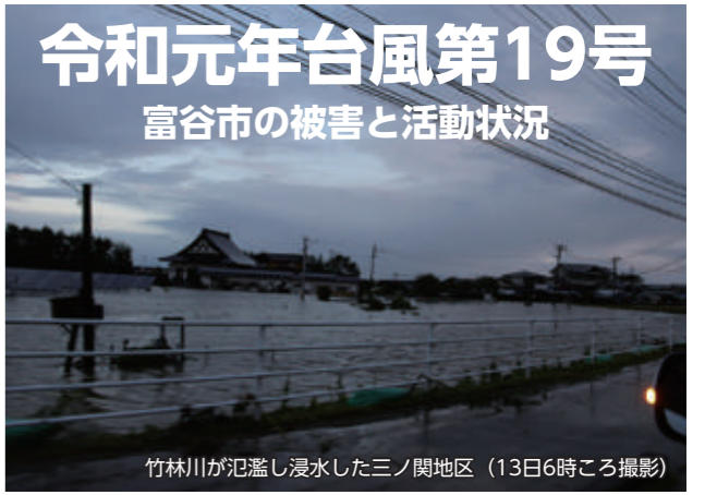
竹林川が氾濫し浸水した三ノ関地区（13日6時ごろ撮影）