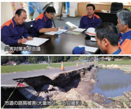
災害対策本部会議

避難に関する情報は、緊急速報メールや防災行政無線、SNS、ホームページなど、複数のツールを活用して発信。公民館や町内会館の8避難所には、89名の方が一時的に避難しました。