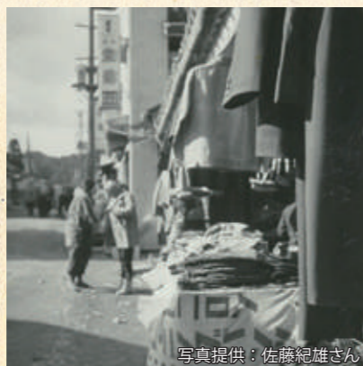
呉服店だった富谷宿の店先から見たしんまち通り。隣家は現在のヤマザキストア「内ヶ崎砂糖店」

そして話は初売りの思い出に。仙台と同様にしんまちも正月の初売りは、夜明け前の暗いうちから、豪華な景品を目当てにお客が並び、大にぎわいだったそうです。「店の板戸がお客に押されて弓のようになつた」と、内ヶ崎さんは言います。開店を待つ間、お客はたき火をたいて寒さをしのぐのが、正月の風景だったと懐かしむ皆さん。当時のにぎわいが聞こえてくるようです。