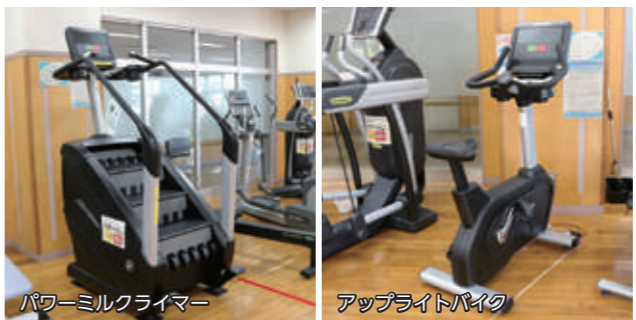
パワーミルクライマーは、スポーツ振興くじ(TOTO)の助成を受けています。