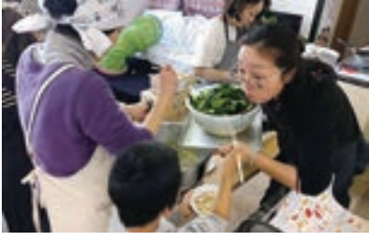
▲親子食堂「みんなあがいで」