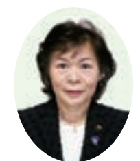
浅野 直子 議員