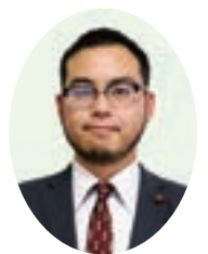
藤原 峻 議員