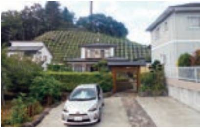
▲ 鷹乃杜浄水場法面