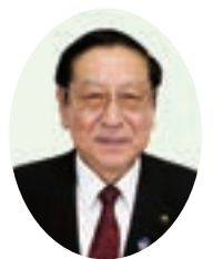
山路 清一 議員