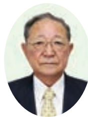
出川 博一 議員

型認定こども園を進め、令和4年4月、民間による認定こども園の開園を目指します。富谷幼稚園につきましては、入園状況等を検証しながら民営化の時期を検討していきます。