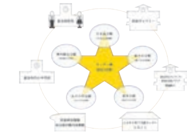
▲ 富谷市ネットワーク型図書館