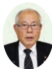
西田 嘉博 議員