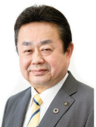
富谷市長 若生 裕俊

誰もが活躍でき豊かな暮らしができるよう「市民力」や「地域力」が発揮できる環境を整え、市民の皆さまとともに「住みたくなるまち日本一」の実現に向けて着実に歩みを進めてまいります。