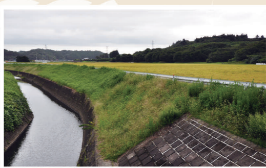
現場となった西成田地区

新興住宅街が広がる富谷ですが、意外にも多様な昔話や伝承が残っています。その中で「小豆洗い婆」と呼ばれる妖怪のお話はご存じでしょうか。旧西成田村の川沿いに一本の道があり、日暮れの際にこの道を通ると、小豆をザルで洗う音が聞こえてきたといわれます。ある人が川の方に行ってみると一人の老婆が小豆を洗っている姿が見えましたが、振り向いたその顔は、恐ろしいもので、その人は腰を抜き、驚いて逃げて帰ったそうです。老婆はキツネが化けた姿だといわれ、夜にこの道を通る人はいなくなりました。