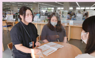
私たち専門の職員が相談をお受けします。気軽にご相談ください。