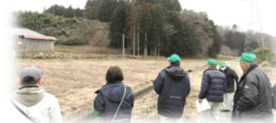
審議案件に係る 現地確認調査の様子