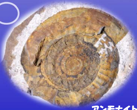
アンモナイト (利府町)