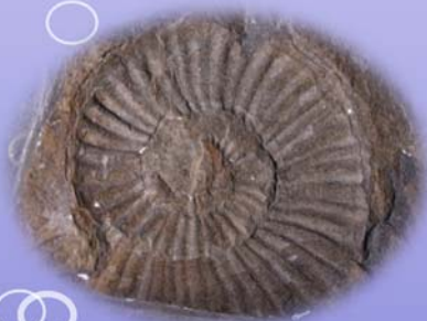
アンモナイト (南三陸町)