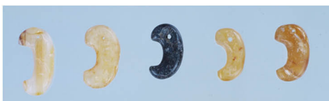
〈勾玉〉朽木橋横穴古墳(大崎市)出土 東北歴史博物館蔵