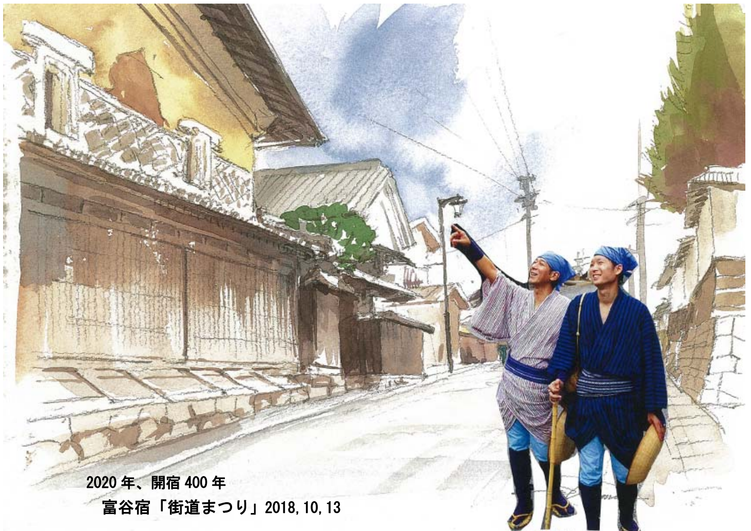
2020年、開宿400年 富谷宿「街道まつり」2018, 10, 13

その昔、お宮が十社。 十宮（とみや）から富谷と 呼ばれるようになったこの地は、 伊達政宗に取り立てられ、 奥州街道の間（あい）の宿として 歴史の表舞台に登場した。