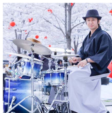
JAZZ 四郎 (富谷市)