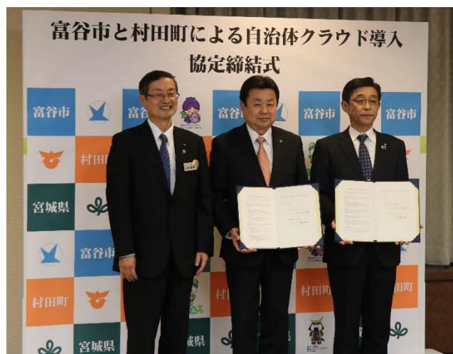
平成29年10月31日 協定締結式