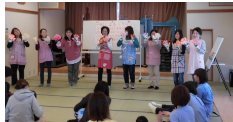
～子育てサロン くーちーぱー～ 今年度初の子育てサロン。 親子で楽しい時間を過ごしました♪

編集発行：成田公民館（成田一丁目1番地1） ・電話 348-3955 ・Fax 348-3024