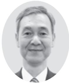
議席番号 19番 あ ずみ とし ゆき 安住稔幸(61歳) 上桜木一丁目 当選回数 5回