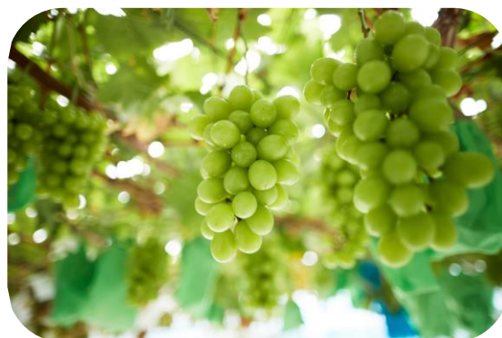
富谷産シャインマスカット