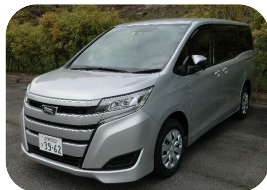
運行車両 トヨタ ノア「ウェルジョイン」