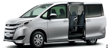
運行車両 トヨタ・ノア「ウェルジョイン」