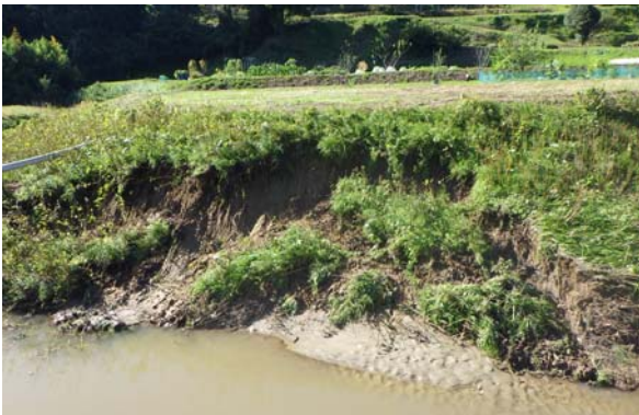
⑤ 【10/13 13:25 準用河川沼田川】