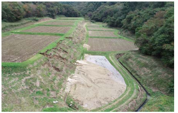
⑧ 【10/18 15:43 大亀 間渡三番】