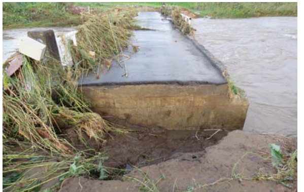
⑥ 【10/13 6:19 本木橋 農道】