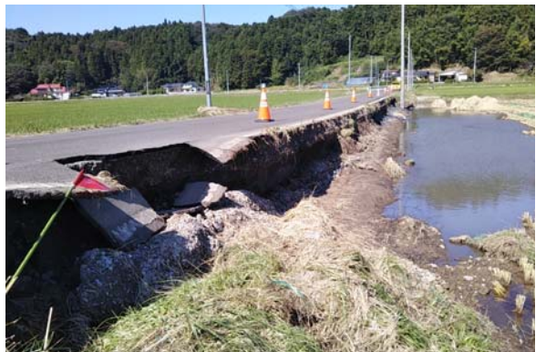
④ 【10/16 11:16 市道新八乙女線】