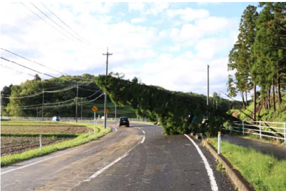
③ 【10/13 6:48 市道今泉大亀線】