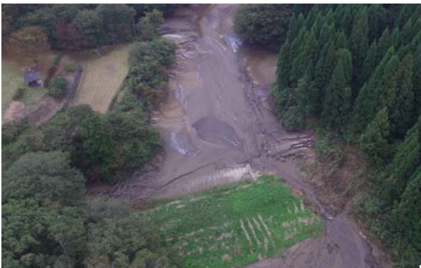
⑦ 【10/18 14:29 明石 万作ため池】