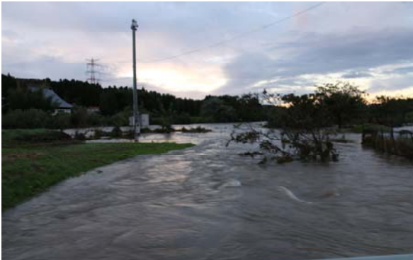
① 【10/13 5:51 市道三志戸田線から撮影した竹村】