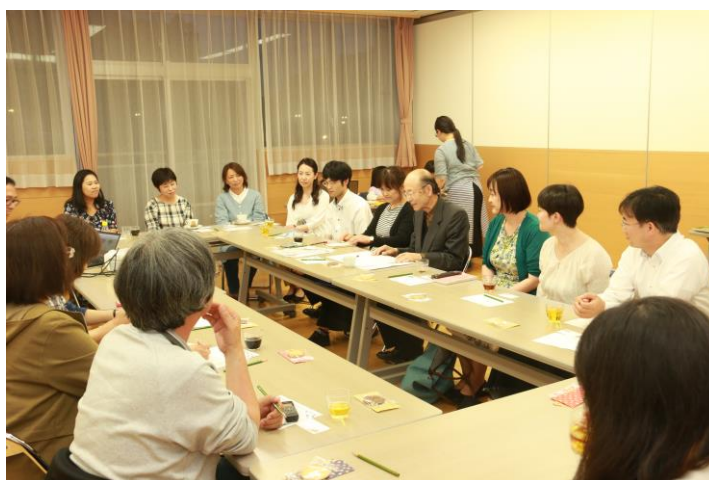
第 1 回とみや図書館カフェ (6/19)